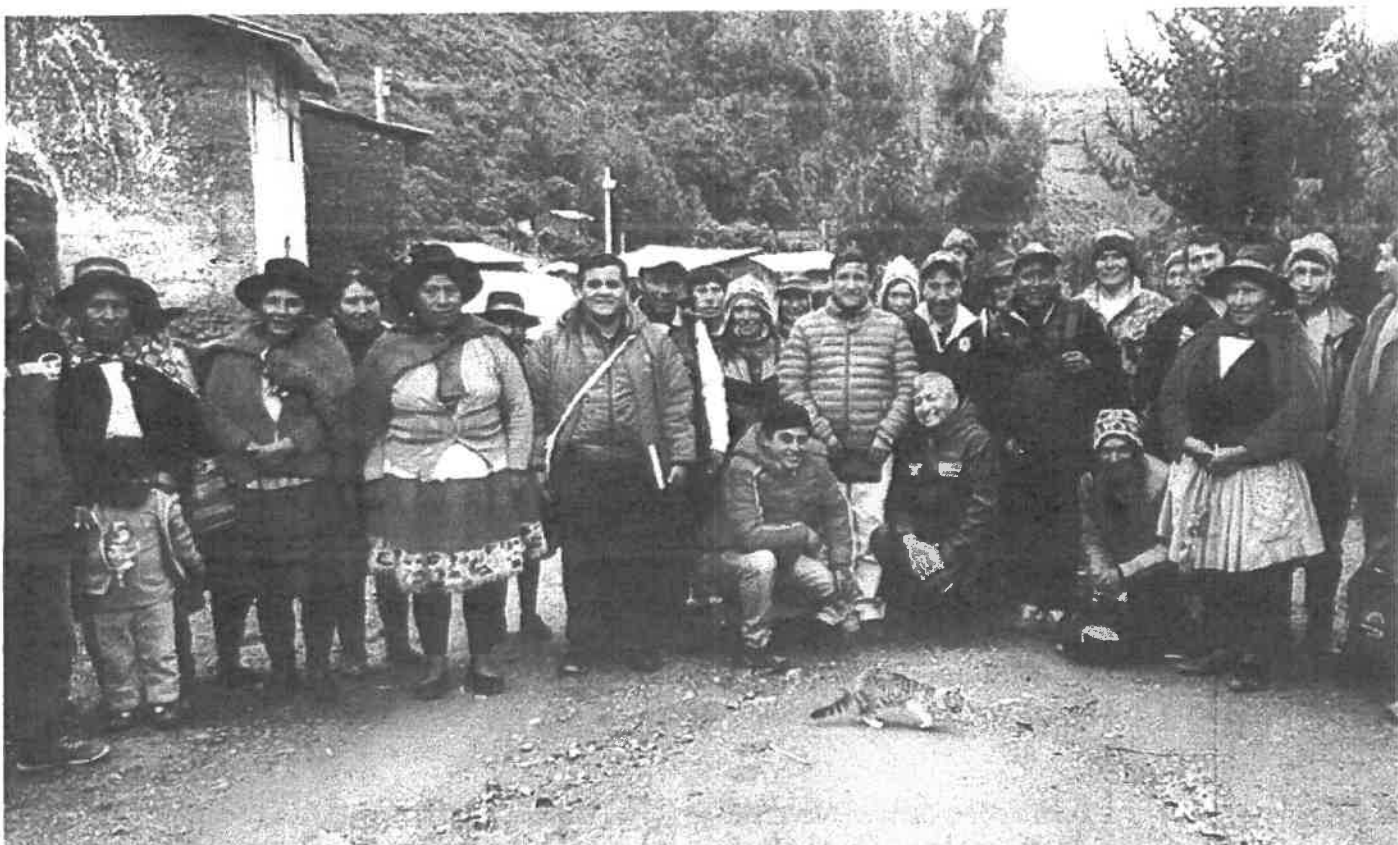
Con los comuneros de la Comunidad Campesina de Parobamba en el distrito de Ayahuanco